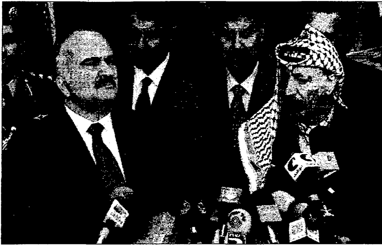
الرئيس الفلسطيني ياسر عرفات وولي عهد الأردن الأمير حسن يتحدثان إلى الصحفيين في رام الله امس بعد اجتماعهما

رام الله - قال امير حسن بن طلال امس الاثنين في مدينة رام الله بالضفة الغربية، في استقبال رئيس الوزراء الاسرائيلي بنيامين نتنياهو الذي يزور الضفة الغربية لاجراء اتصالات مع الجانب الفلسطيني، في سياق عملية إعادة الانتشار للتخارج من بقية أنحاء الضفة الغربية. وقال الامير حسن في ختام لقاء مع الرئيس الفلسطيني ياسر عرفات وعقب لقائه رئيس الوزراء الاسرائيلي بنيامين نتنياهو، إن اللقاء كان فرصة جيدة للتعبير عن التقدير والاحترام المتبادل بين الجانبين، وعلى احترام مطالبات الفلسطينيين. وأضاف أن ذلك سيكون من خلال تطبيق جري المنصوص على اتفاق عليها وسيكون عام 98 عام إعادة الانتشار في مناطق الضفة الغربية. وكان الامير حسن يشير بذلك الى الانتساب الذي نص عليه اتفاق توسيع الحكم الذاتي ويؤكد حواره مع الجانب الفلسطيني الإسرائيلي الذي لا يتناول المفاوضات بين الطرفين كجزء من عام. ودعا عرفات من جانبه الأسرة الدولية الى الاسراع والعمل على حماية عملية السلام، وقال هناك عقبات تعترض مسيرة السلام وان شاء الله سننتقل عليها. وكان عرفات وصف وفي خطاب له يوم السبت الماضي عملية السلام بأنها منقطع النظير الاخيرة بسبب نهج الحكومة الإسرائيلية. وسيتوجه الامير حسن اليوم الثلاثاء الى تل أبيب في لقاء مع امير اولون من نوعه منذ توثيق العلاقات بين الطرفين اثر نجاح عملية الانتشار التي ناقشها في شهر اللوسا الإسرائيلي في عمان في شهر